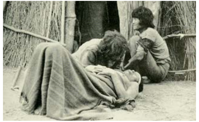
A droite : Un chaman Pilagá souffle sur un malade (Indien Caduveo, ethnique amérindienne vivant au sud du Brésil, dans l'État du Mato Grosso do Sul. (vers 1901, collectées et proposées en 1946 par Claude Lévi-Strauss et Alfred Métraux au Bulletin de la Smithsonian Institution).

Le chamane est un médiateur entre les différents univers où il se déplace : entre visible/invisible ; humains/ animaux ; vie/mort.