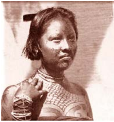
A gauche : Femme caduveo (Photo 1892)